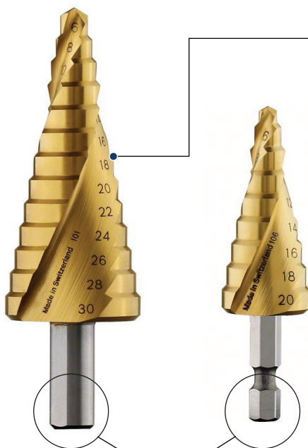
일반 / 육각 두 가지 종류 출시